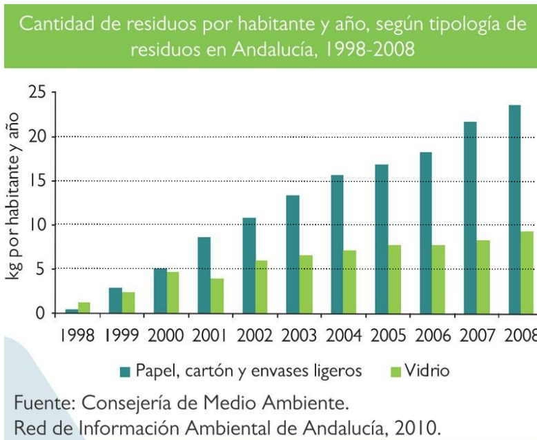
Gráfico 2. Observa el gráfico y responde a las cuestiones planteadas. (15 puntos)

10. Dibuja una gráfica de enfriamiento para el agua, con los datos que te proporciona la tabla. (5 puntos)