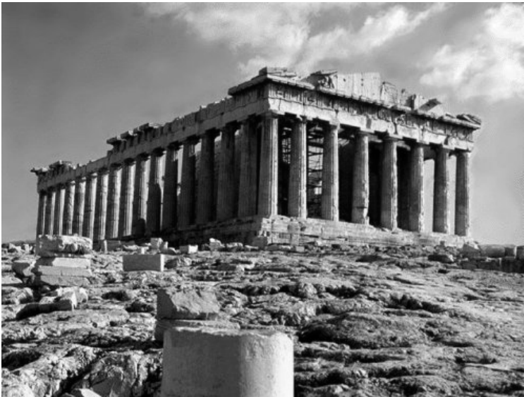
Gráfico 2: Observa las siguientes imágenes y responde a las preguntas que se plantean a continuación.