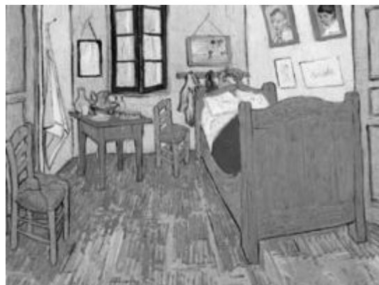
El dormitorio en Arlés. Van Gogh

15. ¿Cuál es el autor de la pintura Los fusilamientos del 3 de mayo ? (2 puntos) Indica las características más importantes de este autor (3 puntos).