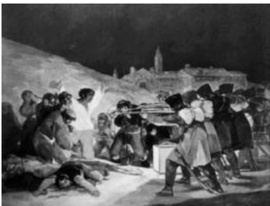
Los fusilamientos del 3 de mayo

Gráfico 2: Observa las siguientes imágenes y responde a las preguntas que se plantean a continuación. (20 puntos)